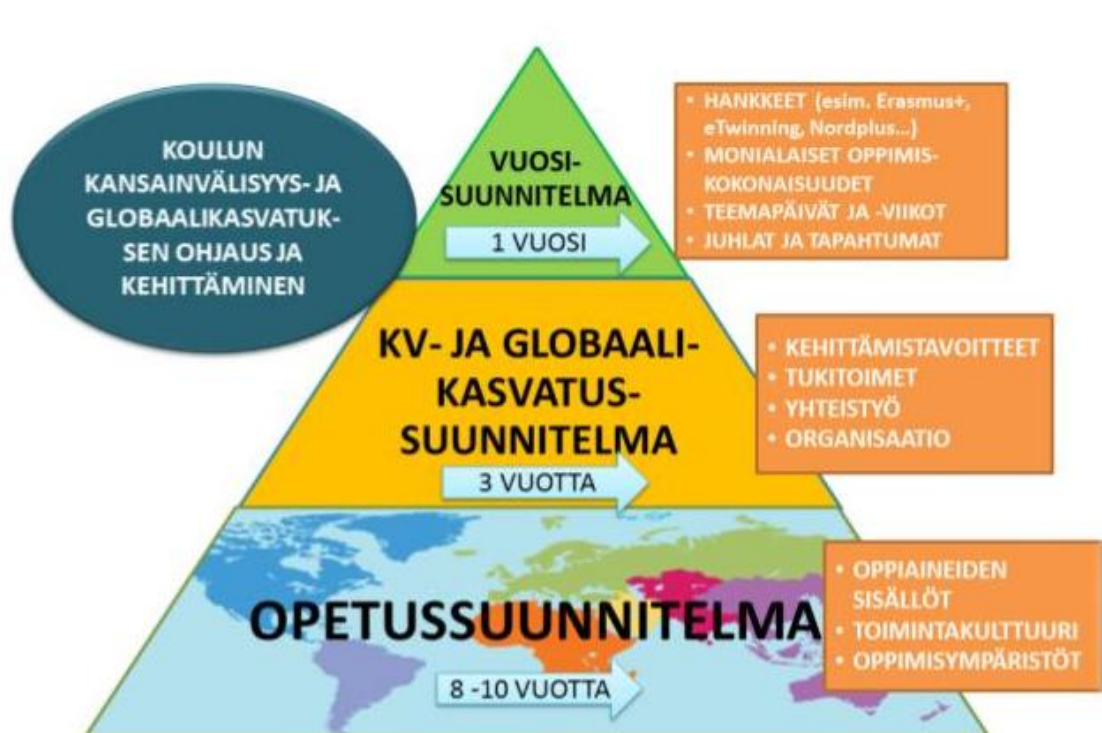
Kuva 1. Koulun kansainvälisyys- ja globaalikasvatuksen suunnitelmatasot

Suunnitelman pääajatuksena on luoda kaikkia kunnan kouluja ja oppilaita koskeva koko koulupolun kestävä kansainvälisyys -sekä globaalikasvatusjatkumo, jonka puitteissa tehdään yhteistyötä yli koulurajojen. Suunnitelmassa luodaan toimintamallit koulujen sisällä toteutettavalle sekä koulujen väliselle yhteistyölle.