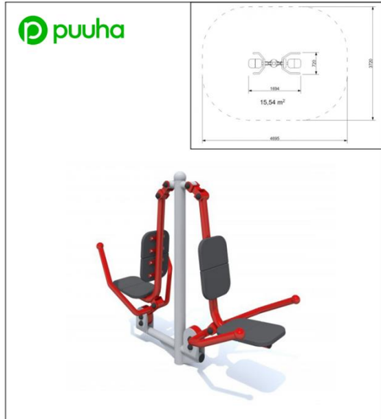
Kuntoiluväline KS-FD-003 Rintaveto/punnerrus