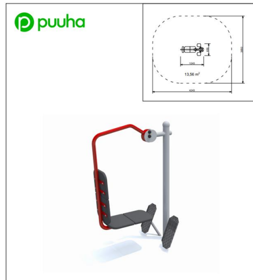
Kuntoiluväline KS-FS-029 Jalkaprässi II