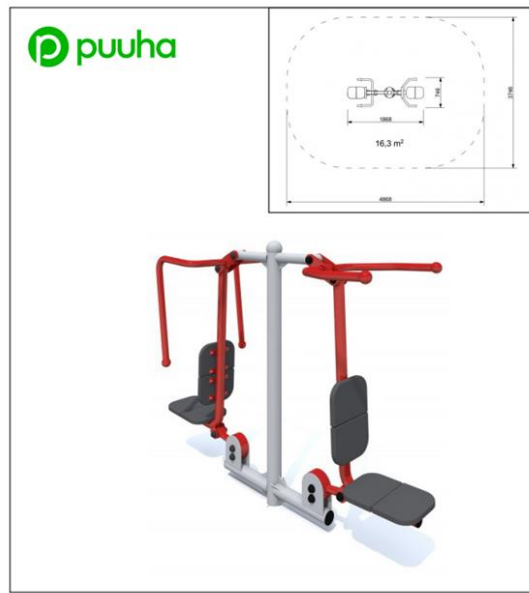
Kuntoiluväline KS-FD-004 Yläveto/punnerrus